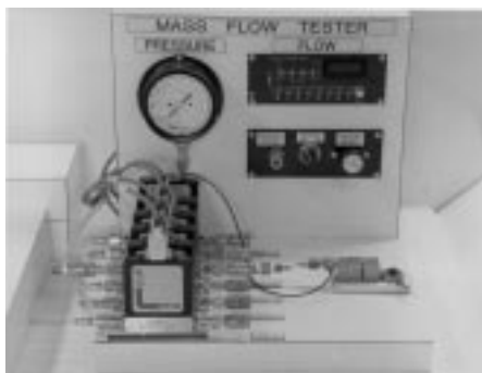
A mass flowmeter measures flow accurately and relatively independent of barometric pressure. The unit shown above is used to obtain the data for calibrated orifices.

For the data presented in the charts on pages 20-22, standard conditions are 70°F and 14.7 psia. For data points measured by O'Keefe Controls Co., the same standard conditions are used.